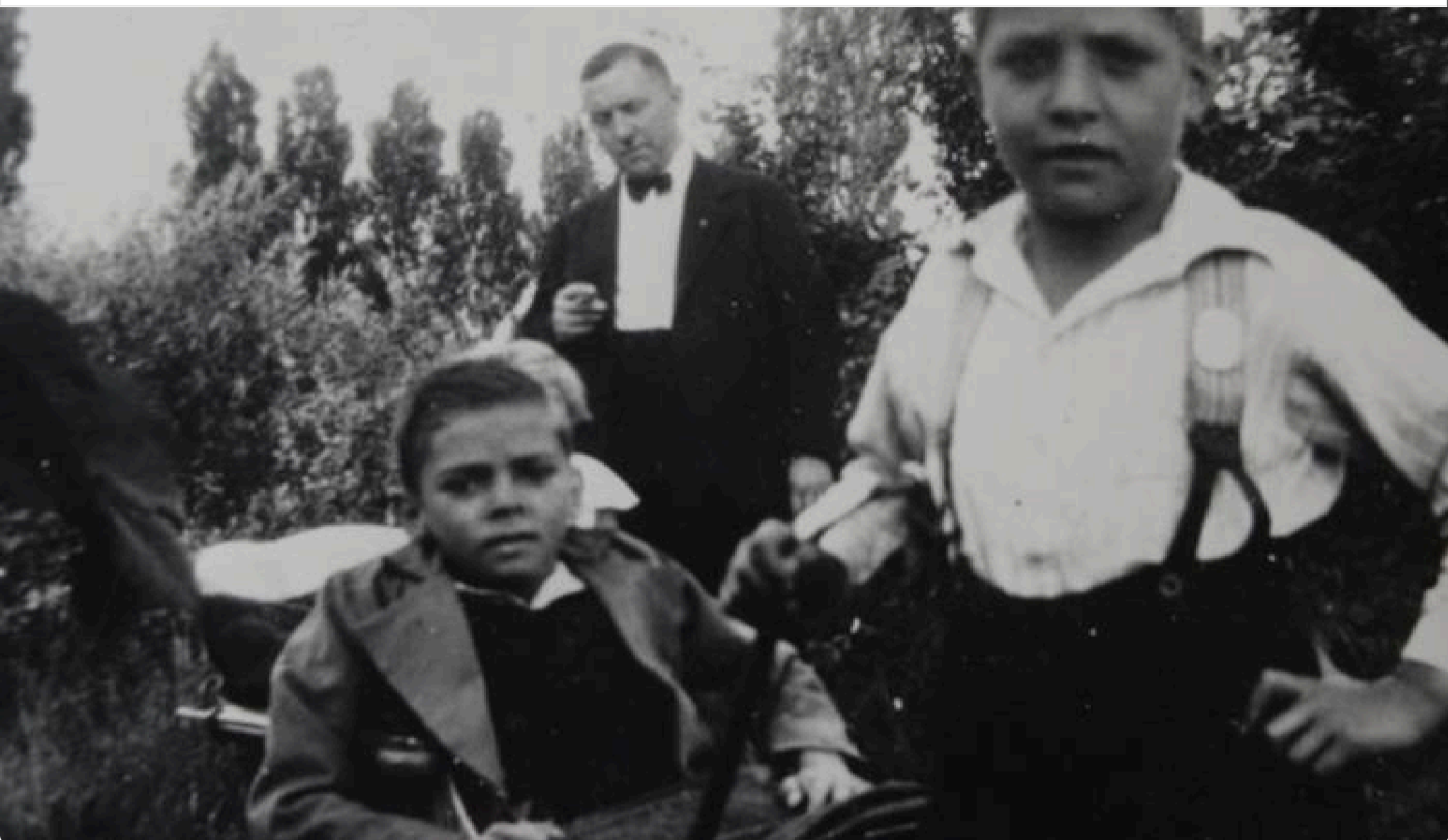
Il fratello in carrozina del padre

CP: Cosa voleva dire fare parte della Hitlerjugend ? E quali aspetti di fascinazione, di seduzione che hai capito essere centrali per tuo padre in quell'esperienza?